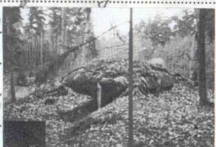
2) Betongbunkern 425:2

1) Löpgräv bakåt i bäcken av det V väret