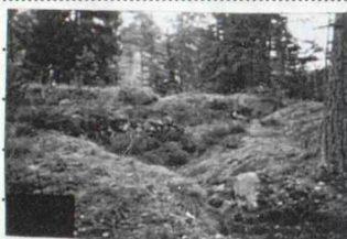
Enl. Järneberg 1987 beaktad av ORL om 1914(425:2)

Ca 20 m NNÖ om V änden av 1 och 3-5 m V om el-spår är 2) Bunker, 5 x 5 m (NV-SÖ) och 2 m h, av betong och med stöldörr i SV, 1-3 skottgluggar på alla sidor och tekventil. Omgärdas av jordbräm.