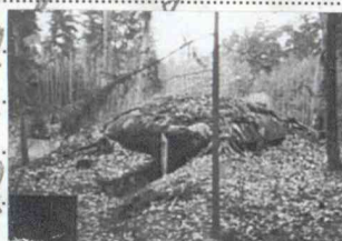
2) Betongbunkern 425:2

1) Löpgräv bakåt i bäcken av det V väret