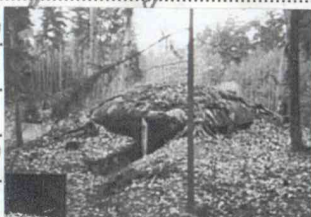
2) Betongbunkern 425:2

1) Löpgräv bakåt i bäcken av det V väret