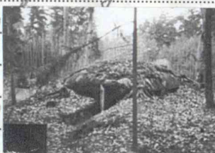
2) Betongbunkern 425:2

1) Löpgräver beaktad i Ödelen av det V väret