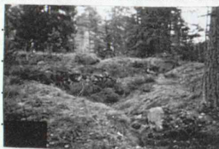
Enl. Järneberg 1987 beaktad av ORL om 1914(425:2)

Ca 20 m NNÖ om V änden av 1 och 3-5 m V om el-spår är 2) Bunker, 5 x 5 m (NV-SÖ) och 2 m h, av betong och med stöldörr i SV, 1-3 skottgluggar på alla sidor och tekventil. Omgärdas av jordbräm.