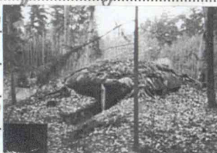
2) Betongbunkern 425:2

1) Löpgräv beaktad i planen av det V väret