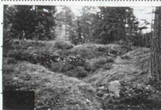
Enl. Järneberg 1987 beaktad av ORL om 1914(425:2)

Ca 20 m NNÖ om V änden av 1 och 3-5 m V om el-spår är 2) Bunker, 5 x 5 m (NV-SÖ) och 2 m h, av betong och med stöldörr i SV, 1-3 skottgluggar på alla sidor och tekventil. Omgärdas av jordbräm.