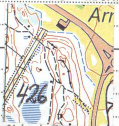
OL-karta Tjiby-Skavlöden 1:10000

Kväs samt avstigs och stängt på NO-sidan av bergshöjd mot sidodalgång. Skogsmark.