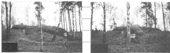
Foton från V av RAN 433 av L. Löthman 2000.

10-15 m N-NNÖ därom är en 9 x 7 m (Ö-V) st grundläm- ning med delvis stenfot. 2,5 m ÖNÖ om SÖ Bunkeränden är en 7 x 3 m (ÖNÖ-VSV) och 1,5 m dj gräv med öppning mot Ö och fylld av block i V. Riserad skyttevärn?