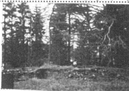
Foto fr. S av bunker i N

Såväl vallor som vallgraver är delvis kvartarade. Värnen verkar röjda och överdäkt enskilda träd och buskar.