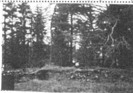
Foto fr. S av bunker i N

Såväl vallor som vallgraver är delvis kvartersade. Värnen verkar röjda och överdort enskilda träd och buskar.