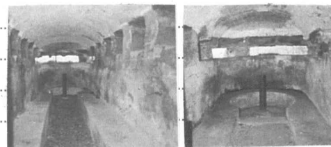
Interiörer i V och i Ö L. Löthman 2000.