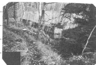
Foto mot ÖSÖ i Ö delen. L.Ln

i S ändast övermannade. Värnet bevänt med enkla barr- och lövträd samt buskar och lövslå.